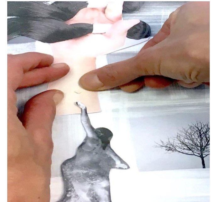
Session 3 Sa. 3. Dezember 2022, 11:00 - 15:30 Uhr

Die Auseinandersetzung beim Fotografieren und das Betrachten von Fotografien ermöglicht vielseitige selbstreflexive Formen von identitätsstiftenden Probehandlungen.