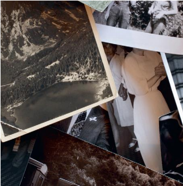
Session 1 Sa. 22. Oktober 2022, 11:00 - 15:30 Uhr